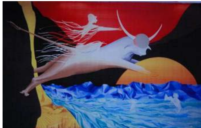
Tapisserie de Marc PETIT, 1984 : « Passer d'une figure statique pour accéder à un rêve ouvert ».