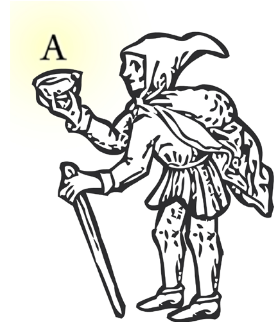
Le blason des Gensfleisch porte Gutenberg plus loin...

En effet, leurs caractères communs sont éminemment mobiles et par nature courants : si l'alphabet doit cultiver la richesse intérieure d'après Platon, l'imprimerie peut développer la lumière de la connaissance et la souplesse de l'esprit. Evitons donc que le navire fou composé en apparence de la jeune EUROPE et du taureau suspect ne nous entraîne comme une Nef encore plus redoutable, en nous condamnant à des naufrages titaniques ; rappelons-nous plutôt la formule biblique souvent citée à propos de GUTENBERG : « Et lux facta est : et la lumière fut ». Suivons les pistes levantines pour sortir des ténèbres intellectuelles, spirituelles, consubstantielles à la nature humaine, et pour aller plus loin ensemble vers l'harmonie. D'une NEF qui rend sage aux GREFFES successives qui surent épanouir L'EUROPE, les signes prometteurs se succèdent en lui offrant d'autres rives, à joindre non plus par des galions colonisateurs, mais par ses équipages libérateurs. Et, cependant, où donc est-elle encore partie, cette EUROPE dont l'enlèvement ornait encore il y a peu le Centre Administratif de la Communauté Urbaine de Strasbourg ?