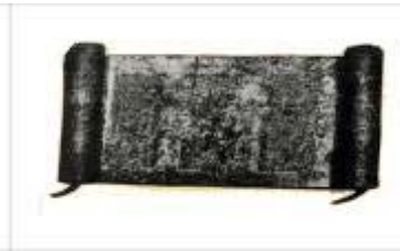
Rouleau de papyrus antique. Muse et lyre.