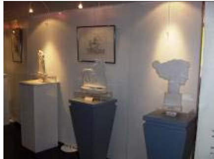
EUROPE se profile

Si, après des millénaires où tour à tour cette figure a paru et disparu, couru et crû, les œuvres inspirées par l'enlèvement d'EUROPE semblent nous avoir été ravies, si l'image de cet envol a déserté les édifices strasbourgeois, peut-être s'est-il enfui pour mieux mettre au jour, puis pour remettre à flot, une EUROPE enfouie dans les profondeurs de notre histoire personnelle et collective.