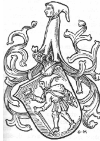
Blason de la famille Gensfleisch.