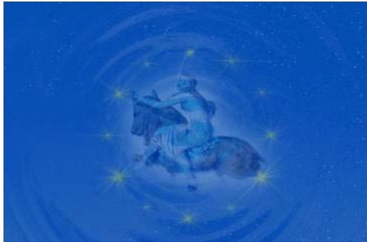
Un drapeau pour éclairer l'Europe et ses traversées, d'une constellation qui dure même dans la tempête obscure.

Ce qui nous nomme nous rend moins sots, nous sort du somme, nous rend plus hommes, aptes au saut : ce que nous sommes nous signe comme l'éclair d'un sceau : plus qu'une somme, voici le beau. L'obscurité soudain tremble... Les cœurs s'éveillent ensemble. Ils étaient las, mais ELLE est là, si discrète – parmi des milliers de Strasbourgeois, des millions d'Européens, la joie toujours prête, murmurant son NOM jailli des mers et millénaire ; il en dit si long que notre horizon se développe, que toutes nos ombres vont s'écarter devant l'afflux puissant de la clarté, que notre souffle se libère : EUROPE.