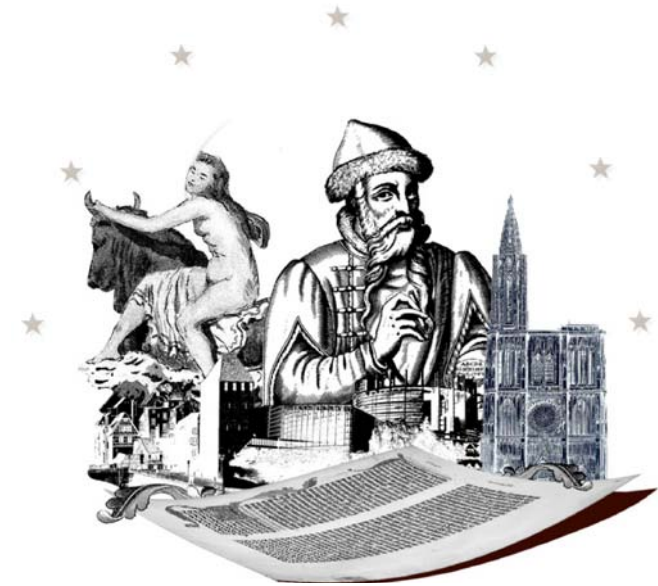
Strasbourg, carrefour de routes notiques .

La musique ou la danse, tous les arts, naissent dans les lieux où les groupes humains pratiquent une hospitalité généreuse et curieuse, inventive et mobile, associant les communications dans l'espace et le temps, entre les vivants comme avec les novateurs immortels : à la place de l'antique symbole permettant et perpétuant des retrouvailles, nous disposons de NOTES saisies au vol pour jeter par poignées des portées d'harmonie comme on trace un sillage marin, comme on sème dans les âges des connaissances et des poèmes durables, qui se montreront féconds à leur tour.