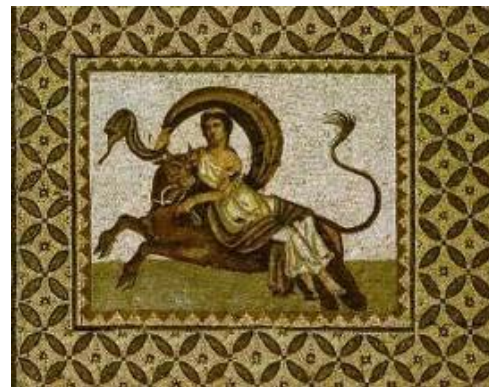
Une mosaïque de Byblos datant du III e siècle de notre ère.