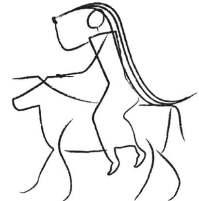
Linéaments de l'amazone Europe.