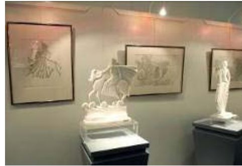
L'Enlèvement d'Europe par M. PAPAConstantinos, photo Parlement Européen.

Nous voilà en tout cas, sur les champs de toute navigation moderne, à travers les mers, le numérique et les airs, en possession de bons moyens d'orientation NAUTIQUE et d'une NOTATION claire : au fil de nos routes NOTIQUES , avec la grâce d'EUROPE, avec l'audace de GUTENBERG, la nef des fous doit et peut céder la place à des greffes réussies, à la construction d'une Union juste, à l'exploration fraternelle de la vérité, bref à l'aventure de la paix.