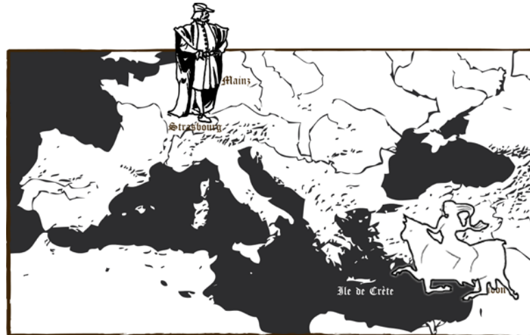
Europe enlevée fait lever de Crète les techniques phéniciennes, qui rayonneront vers Strasbourg, Mayence... pour tisser l'Europe.

Etrange et fertile homonymie qui relie les techniques de la culture et de l'écriture !