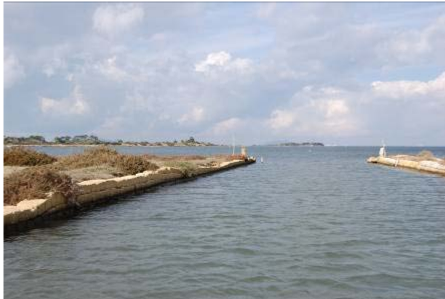
Chenal menant de la route phénicienne de Sicile à l'îlot de Motyé (Mozia).

Le thème de la nef des fous reflète également l'essor rhénan de cette cité au seuil de la Renaissance, de ses productions artisanales, artistiques, intellectuelles, de son commerce et de ses communications. D'une manière plus générale, ne demeurons-nous pas tous embarqués dans une traversée existentielle comme le disait PASCAL en son « pari », et obligés de prendre parti contre toutes les galères ?