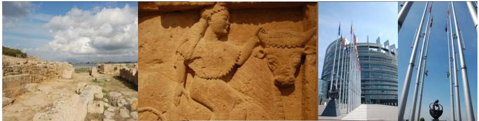
De la Sicile, avec l'îlot phénicien de Motyé et la métope de Sélinonte, à Strasbourg avec le Parlement Européen et « Europe à cœur ».