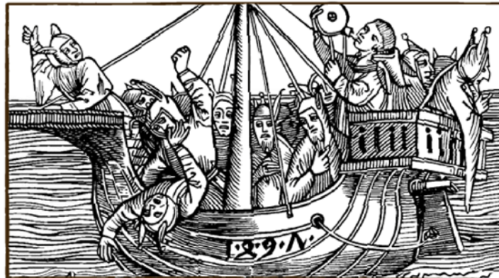
La Nef des fous de Sébastien Brant (1494).