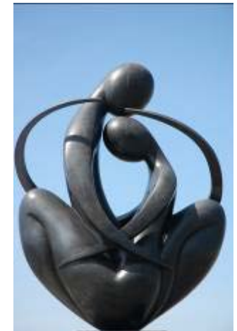
et « Europe à cœur » par L. TCHERINA, 2000.