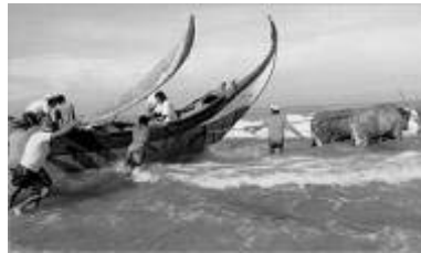
Bovins marins photographiés au Portugal par Jean-Claude Martinez. Bateau phénicien.