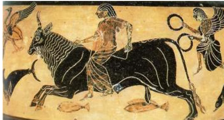
Une céramique de Caeré datant du VIe siècle avant notre ère.

Au Ve siècle avant notre ère, notre premier historien, Hérodote, se contenta de souligner l'homonymie entre une jeune femme mythique enlevée du rivage phénicien – actuellement libanais – par le dieu grec Zeus, et la région du monde appelée aussi l'Occident. Mais un mythe n'est jamais un conte à dormir debout, et l'inconscient collectif suscite les récits merveilleux qui, loin de bercer le public, le tiennent en éveil, résumant et rallumant tour à tour l'évolution de l'humanité !